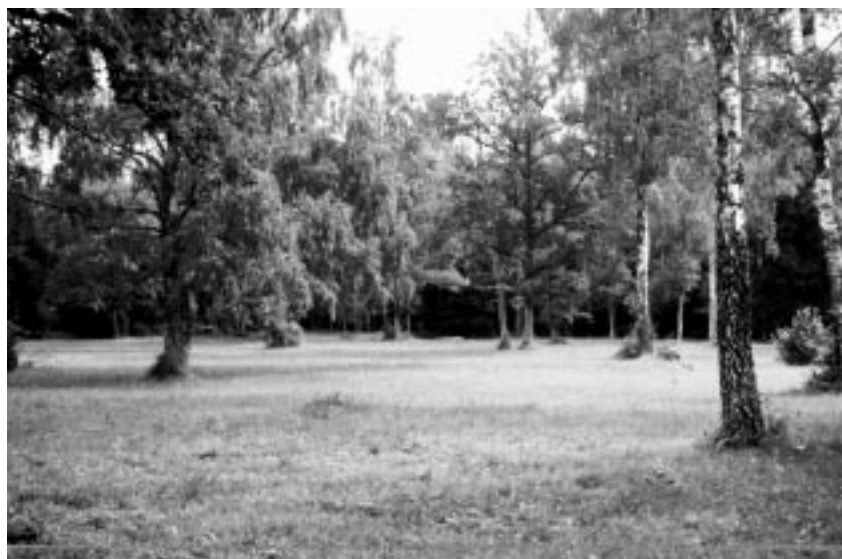
Mäepea puisniit Saaremaal

Puisniit kui kooslus on väga vana. Arvatakse, et puisniiduilmeline maastik tekkis Eesti aladel koos esimeste inimasualadega. Puisniidu võisid meie esivanemad kujundada metsast, seda pikkamööda harvendades, võsa